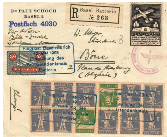
Chargé-Brief: Basel-Bône (heute Annaba), 10.5.1925, mit Sonderflug von Basel nach Zürich

Durch das Interesse am Thema «Ausland-Schweizer im französisch besetzten Algerien» und durch die Lektüre eines Tages-Anzeiger-Artikels in den 1980er Jahren über die Schweizer Fremdenlegionäre auf jenem Territorium. Es ist meine Leidenschaft, historische Forschung zu betreiben und es ist meine Absicht, für die Nachwelt Dokumente und philatelistisches Quellenmaterial zusammenzustellen, das einen kaleidoskopischen Blick auf die Beziehung der Schweiz zum französischen Algerien ermöglicht.