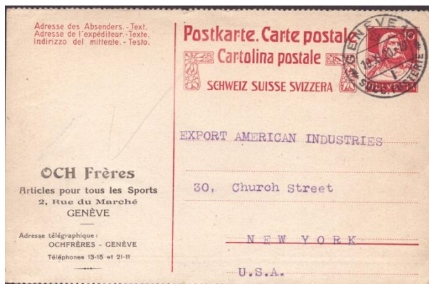
eine der seltensten Postkarten der Schweiz

1978 wurde ich als philatelistischer Juror in den USA anerkannt und verfasste später das Kapitel über Postsachen im Judges Manual der American Philatelic Society. Im Jahr 2025 veröffentlichte ich gemeinsam mit Didier LeGall das rund 300 Seiten umfassende Werk British East Asia Postal Stationery . Im selben Jahr ehrte mich die American Philatelic Society mit ihrer höchsten jährlichen Auszeichnung, der Luff-Medaille für Forschung.